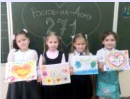
Материал подготовила Альбина ГРИЦЕНКО, Медиационный центр МБУ ДО ЦДОД

Творческим и запоминающимся стал классный час для наших детей.