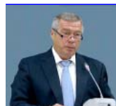
ГОЛУБЕВ Василий Юрьевич , губернатор Ростовской области

...Для учеников начальных классов в школах организовано бесплатное горячее питание. Посещение учениками столовой будет организовано таким образом, чтобы минимизировать контакты между детьми.